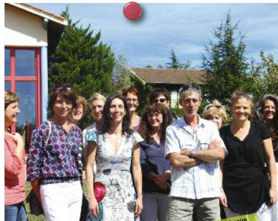
Instituteurs de l'école primaire des Chadrillons