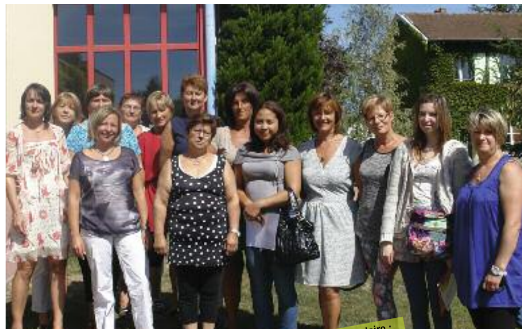
L'équipe périscolaire : restaurant, loisirs, garderie