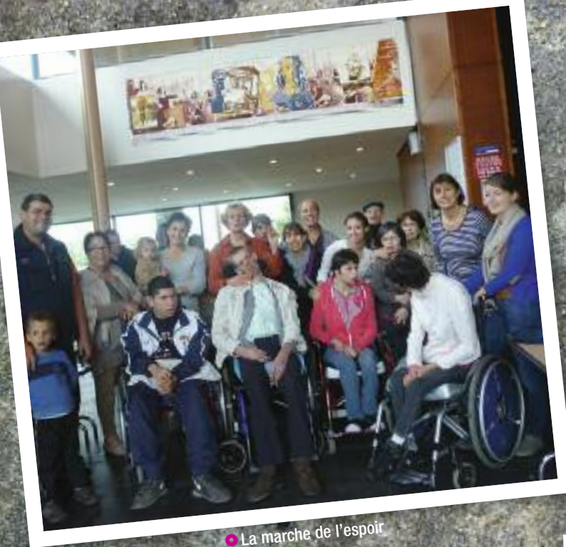
● La marche de l'espoir