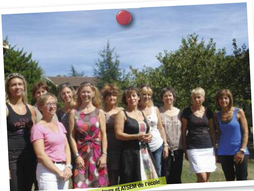
Instituteurs et ATSEM de l'école maternelle des Chadrillons