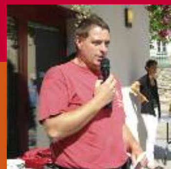
Fête de la pêche de vigne